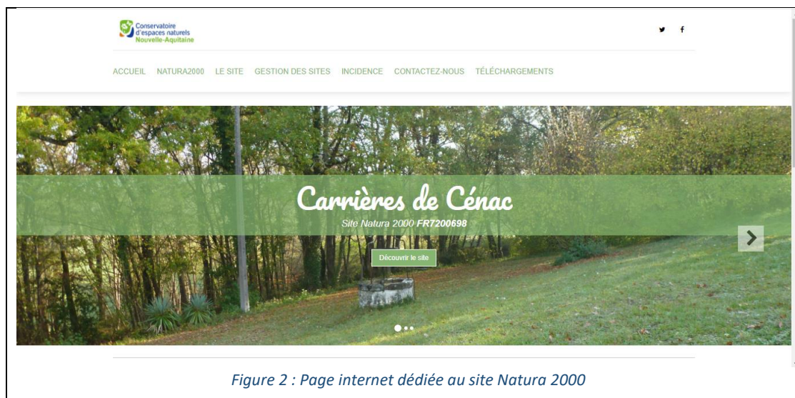
Figure 2 : Page internet dédiée au site Natura 2000

Il est important de noter que ce site est transférable en cas de changement d'animateur. Le site est opérationnel depuis début 2021 et peut être visité à l'adresse suivante : https://carrieres-cenac.fr/